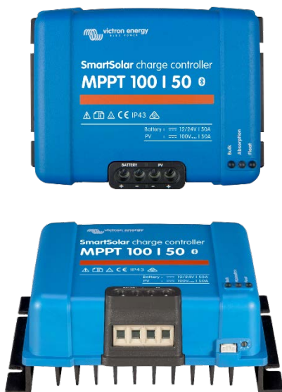
SmartSolar Lade-Regler MPPT 100/50

Apple und Android Smartphones, Tablets und weitere Geräte. - Color Control-Panel