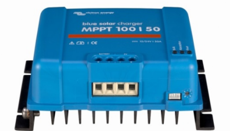
Solar Lade-Regler MPPT 100/50